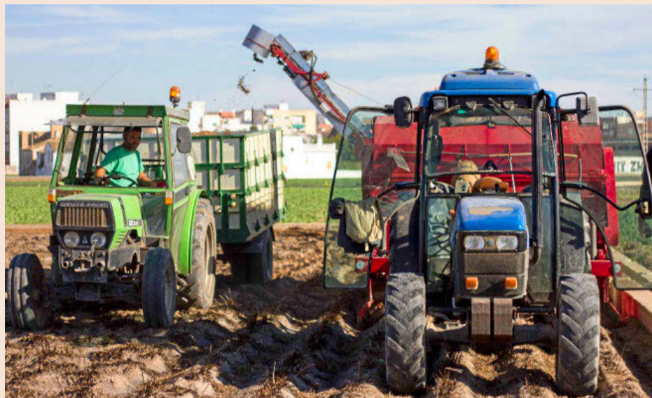
Imágenes de los primeros días de cosecha de chufa en Valencia.

Paralelamente ha ido creciendo la superficie cultivada (ver cuadro adjunto). El Consejo regulador Chufa de Valencia refleja que actualmente se cultivan 5.868 hanegadas (una hanegada son 831 metros cuadrados) en los diecinueve municipios acogidos a la denominación, con un aumento del 12% respecto a la pasada temporada. No es el nivel más alto histórico, pero sí se observa un incremento en los últimos años. Sin embargo, aunque la producción también aumenta, lo hace a menor ritmo que la superficie, lo que está derivando en una disminución del rendimiento de los terrenos de cultivo. La proliferación de una enfermedad denominada mancha negra ha causado este descenso. Aún no hay datos de esta campaña, pero se esperan unas 8.000 toneladas, un 10% más. Desde el consejo explican que "llevamos unos años de investigación con el Instituto Valenciano de Investigaciones Agrarias (Ivía), para dar solución a este problema y que pasa por un saneamiento de la simiente. En ese sentido, tenemos en marcha este año algunas parcelas donde estamos reproduciendo esta semilla para ponerla a disposición del agricultor entre la próxima campaña y la siguiente, que conllevará un mejor rendimiento. Ciframos, con los datos que tenemos de años anteriores, que podría